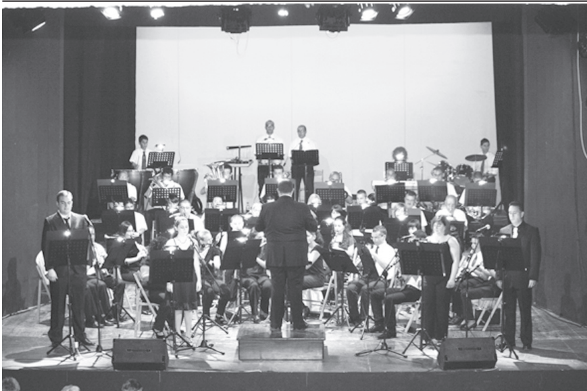
Dehra ġenerali tal-Orkestra fl-Oratorju Don Bosco flimkien ma' uħud mill-kantanti li ħadu sehem

F'Santiago de Compostela fi Spanja Mons Isqof mexxa pontifikal fil-Katidral flimkien mal-Monsinjuri tal-istess Katidral, kif ukoll mexxa l-funzjoni tal-inkensazzjoni tradizzjonali li ssir f'dan il-post.