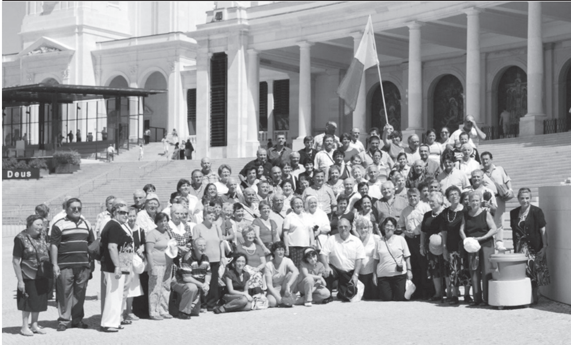
Parti kbira mill-grupp ta' pellegrini fil-pjazza tas-Santwarju ta' Fatima wara ċ-ċelebrazzjoni tal-quddiesa internazzjonali