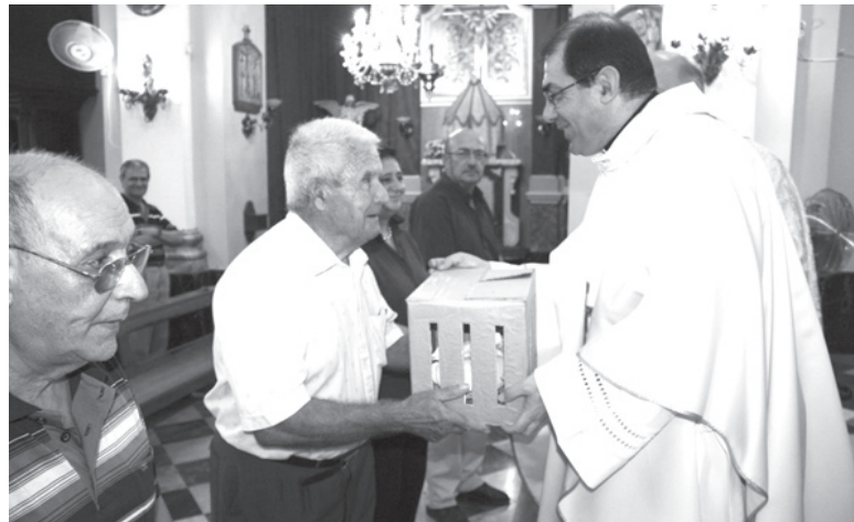
Mal-offerti ttellgħa wkoll par ħamiem minn Franġisk Portelli min-Nadur, bħala tifkira tal-imħabba li kellu San Franġisk t'Assisi lejn il-holqien

Wara fuq iz-zuntier tal-Knisja saret iċ-ċerimonja tat-tberik tal-annimali.