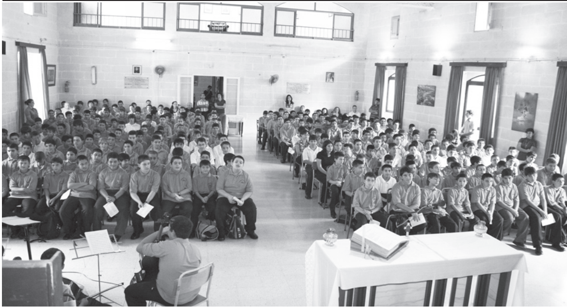
L-istudenti li attendew għall-quddiesa tal-okkażjoni fil-ftuħ tas-sena skolastika tas-Seminarju Minuri