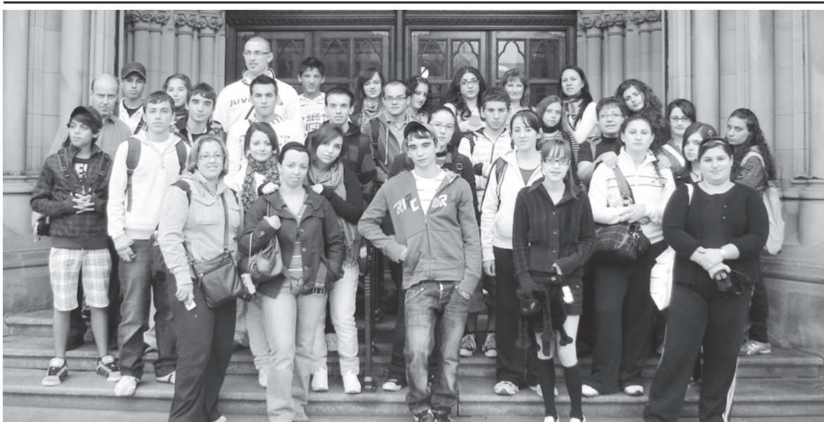
Iż-żgħażaġh Għawdxin fl-Ingilterra