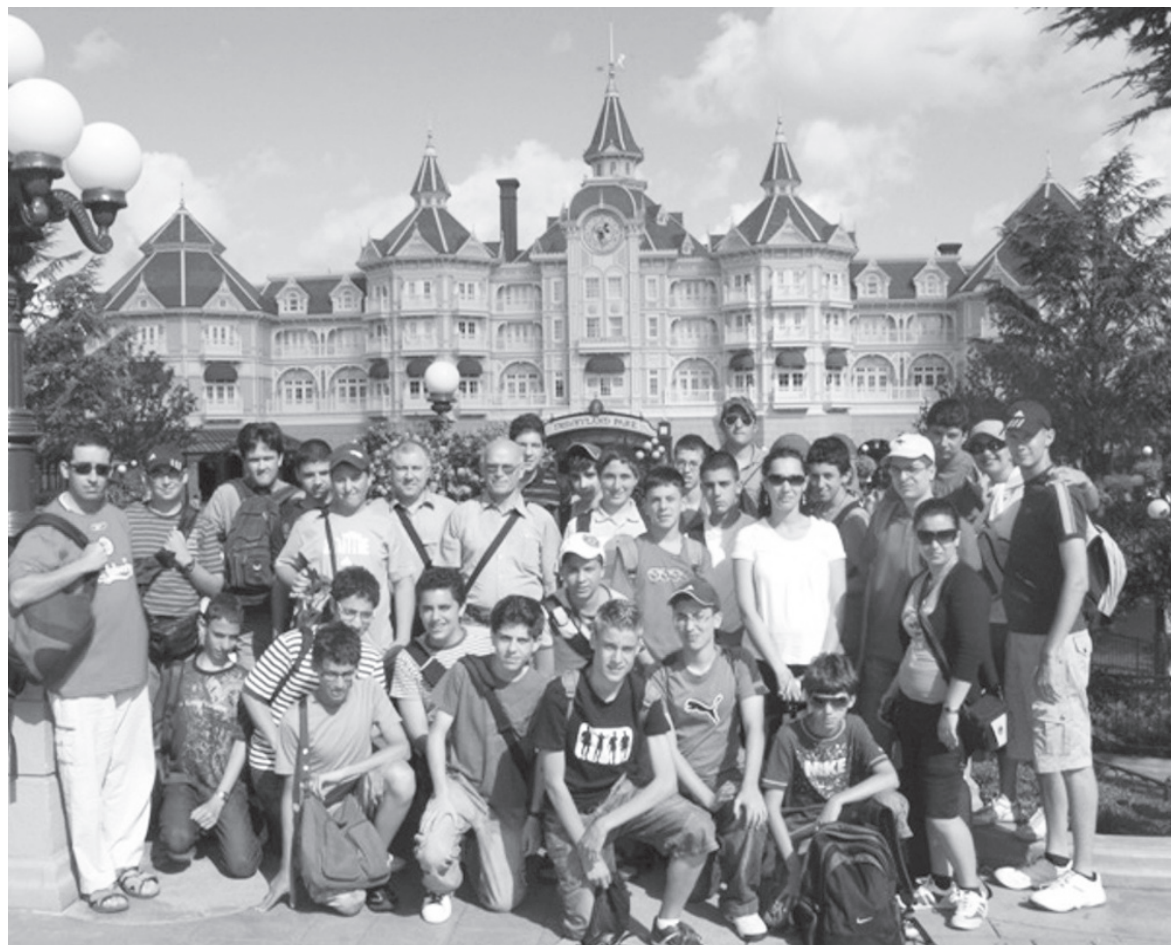
L-istudenti tas-Seminarju jidher flimkien mal-għalliema tagħhom waqt iż-żjara li għamlu f'Disneyland