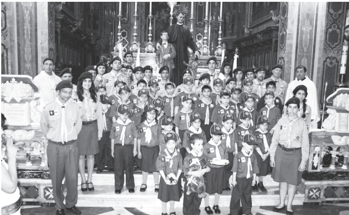
Ix-Xagħra Scout Group fil-Knisja Bażilika ta' Marija Bambina