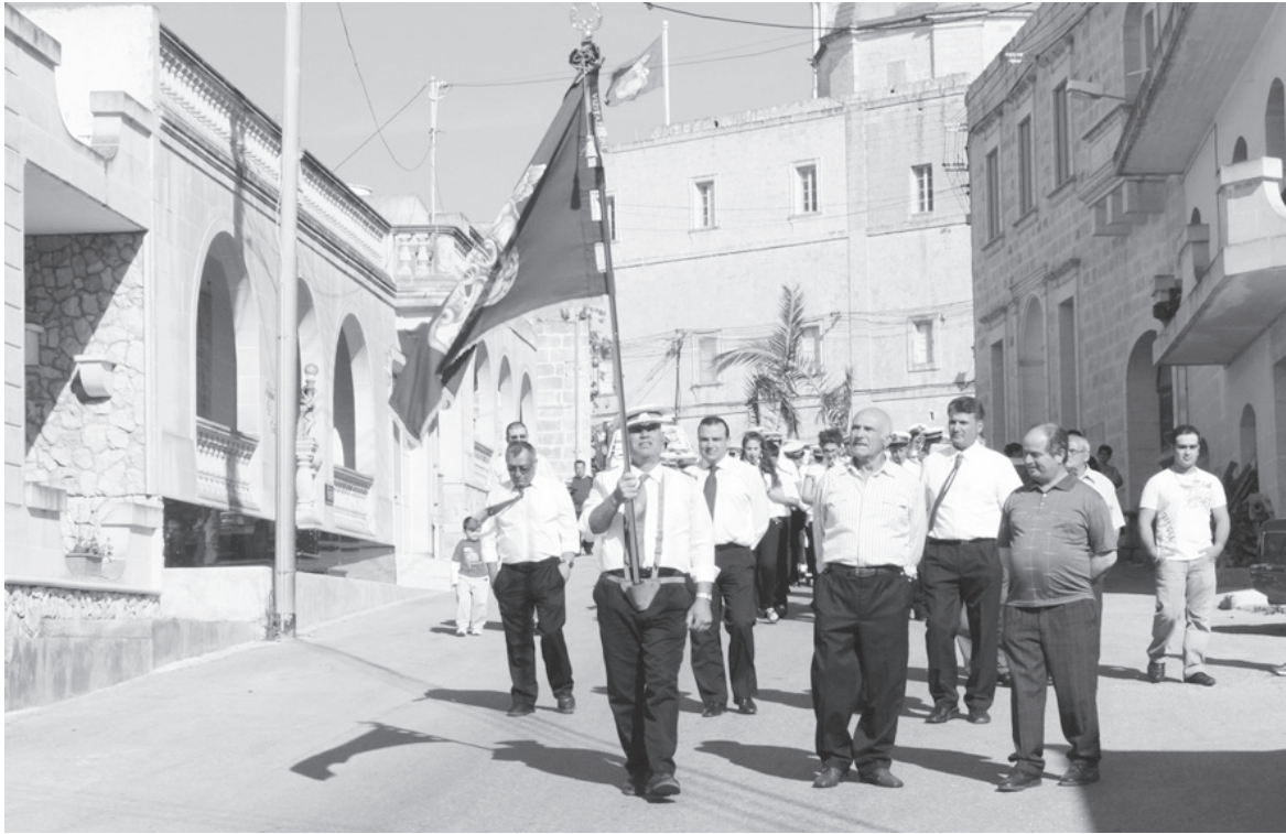
Il-Banda Viżitazzjoni mill-Pjazza tal-Knisja Bażilika fi triqtha lejn il-Knisja taż-Żejt, takkumpanja b'daqq ta' marči l-qniepen il-godda