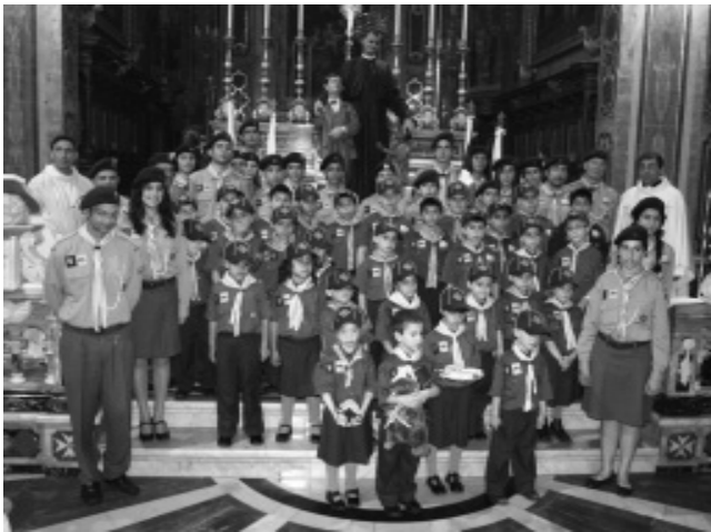
Ix-Xaghra Scout Group fil-Knisja Bażilika ta' Marija Bambina

li nqara dakinhar, qed jaqdu dmirhom lejn Alla, lejn Art Twelidhom u li jghinu lil haddiehor f'kull hin.