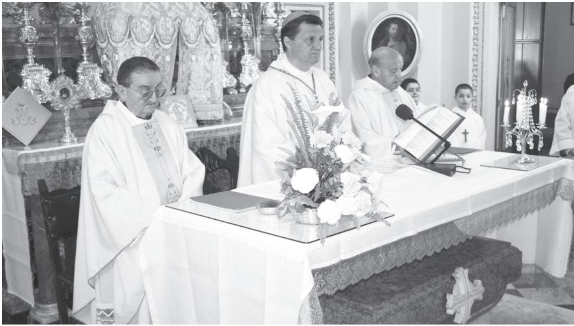
Waqt iċ-ċelebrazzjoni tal-quddiesa fil-Knisja tas-Sorijiet Franġiskani