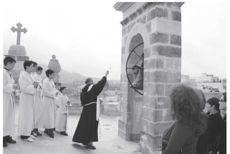
Waqt iċ-ċerimonja tat-tberik tal-kampnar u l-qanpiena tas-Santwarju tal-Madonna tal-Grazzja