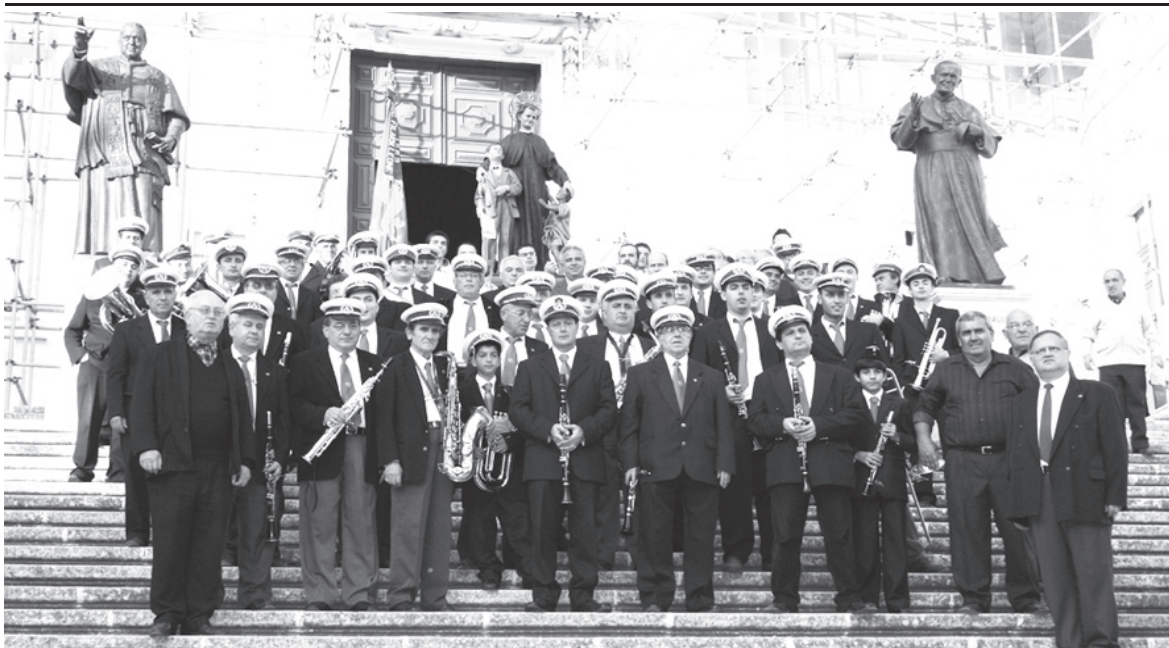
Il-Banda Ċittadina Leone fuq it-taraġ tal-Knisja Katidrali hekk kif San Ġwann Bosco kien wasal biex jidhol fil-Katedral