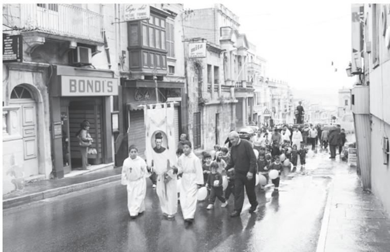
Il-Manifestazzjoni tat-tfal fi triq it-Tigrija, fi triqtha lejn l-Oratorju Don Bosco