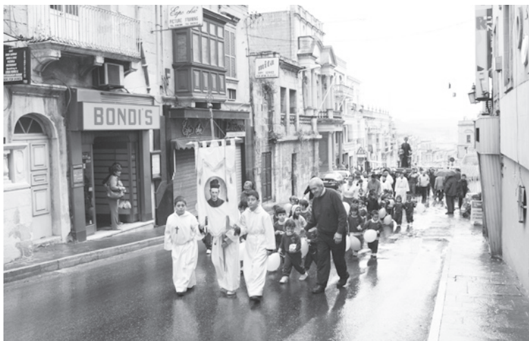
Il-Manifestazzjoni tat-tfal fi triq it-Tigrija, fi triqtha lejn l-Oratorju Don Bosco