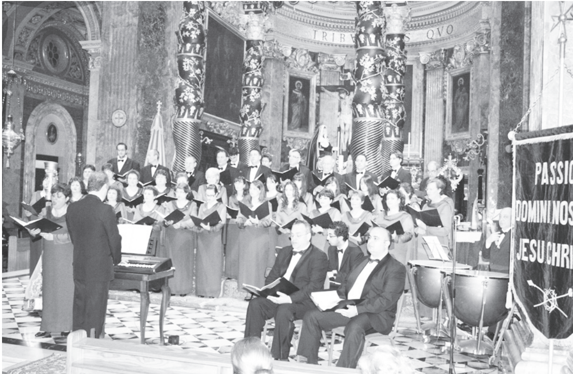
Il-Chorus Urbanus waqt il-cantata fil-Knisja Bażilika ta' San Ġorġ, fir-Rabat, Għawdex