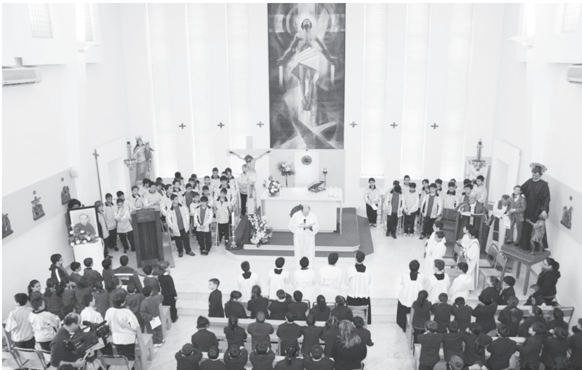
Mument waqt iċ-ċelebrazzjoni tal-Quddiesa tal-okkażjoni fil-Kappella tal-Oratorju Don Bosco