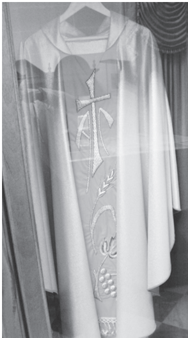
Il-Pjaneta użata mill-Qdusija Tiegħu l-Papa Gwanni Pawlu II waqt il-quddiesa li ċelebra f'Ta' Pinu