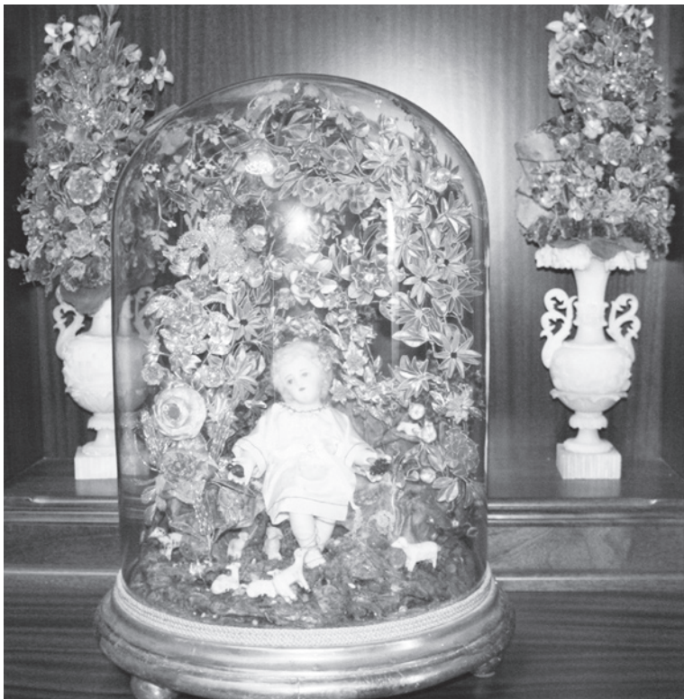
Oggetti esebiti fil-Mużew tas-Santwarju Ta' Pinu

Ma' dawn wiehed jista' jara esebiti il-fwejjeg u oggetti li uza il-Papa Gwanni Pawlu II fil-1990 meta għall-ewwel darba żar is-Santwarju Ta' Pinu fejn fuq iz-zuntier tas-Santwarju ċelebra quddiesa.