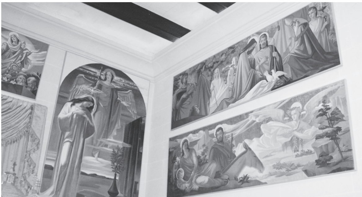
Pitturi ta' Emvin Cremona

u lil Franġisk Portelli kif ukoll lil Dun Ġużepp Portelli, ir-Rettur li bena dan is-Santwarju Ta' Pinu. Dan il-Mużew ser jibqa' jkun miftuħ għall-pubbliku kuljum mid-9.30 a.m. sa 12.00 (nofsinhar). Id-dñul hu bla ebda ħlas, għalkemm jkunu apprezzati donazzjonijiet biex ikun jista' jtkompla x-xogħol ta' manutenzjoni u restawr ta' dan is-Santwarju. Fil-prezent qed issir ħidma biex jiġu restawrati sett ta' pitturi ta' Giuseppe Briffa.