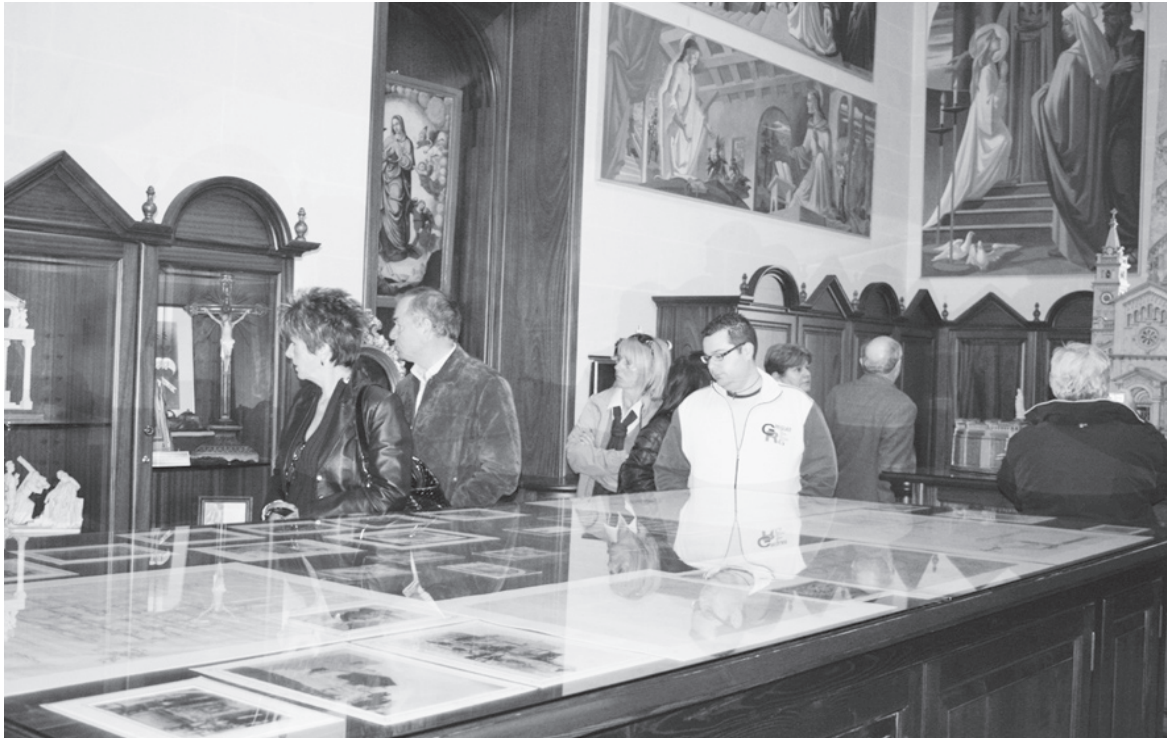
Waqt l-open day fil-Mużew tas-Santwarju Nazzjonali tal-Madonna Ta' Pinu