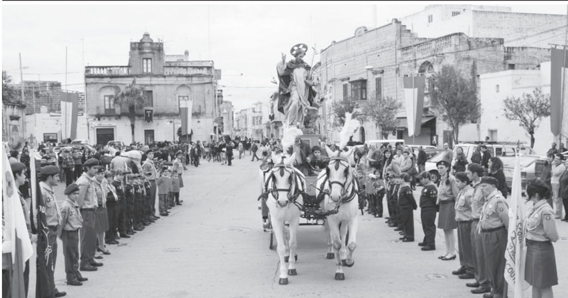
Sant'Anton Abbati fuq il-parilja joqrob lejn il-Knisja Bażilika ta' Marija Bambina.

Wara li spiċċat din iċ-ċerimonja, l-Cubs, l-iScouts u l-Venture Scouts tal-Victoria Scout Group u membri tax-Xagħra Scout Group inqasmu fi gruppi li kienu mmexxija mil-liders taż-żewġ gruppi. L-attivitajiet li saru kien tindif fil-Polverista fiċ-Ċittadella, fil-Wied ta' Żejta, fl-inħawi tal-parking ewlieni tar-Rabat u fil-Calypto Cave, b'dan tal-aħħar isir mix-Xagħra Scout Group. Sar ukoll xogħol ta' tiżbiġ fir-Respite Centre tal-Fundazzjoni Arka, Għajnsielem. Sar ukoll thawwil ta' diversi sigar tal-ħarrub f'Għajnsielem.