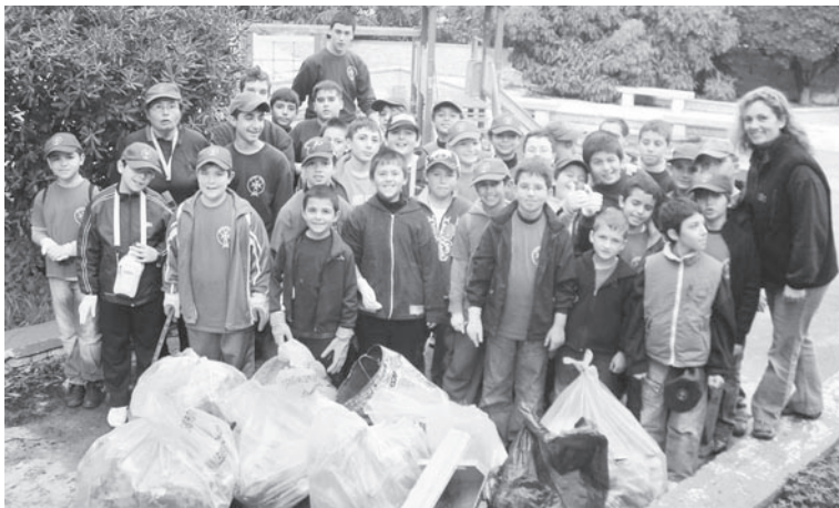
Waqt l-attività tat-tindif fl-inħawi tal-parkeġġ tar-Rabat.

AĦBARIJET MINN GĦAWDEX ma' Charles Spiteri