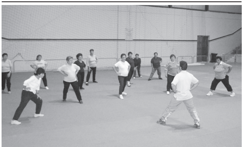
Parteċipanti waqt waħda mis-sessjonijiet fil-kors tal-fitness fil-Kumplex Sportiv.