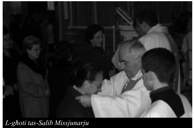
L-ghoti tas-Salib Missjunarju

"Il-Knisja f'Malta tixtieq tkun kewkba bħall-kewkba tal-Maġi prezenti fil-hajja, biex permezz tal-Kelma ta' Alla takkumpanjahom u tgħinhom biex f'hajjithom ifittxu lil