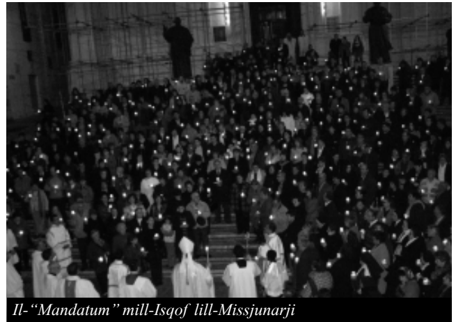
Il-"Mandatum" mill-Isqof lill-Missjunarji

Alla bis-sinċerità, jsibuh, u jadurawah bħala l-Mulej li kapaċi jibdel hajjithom".