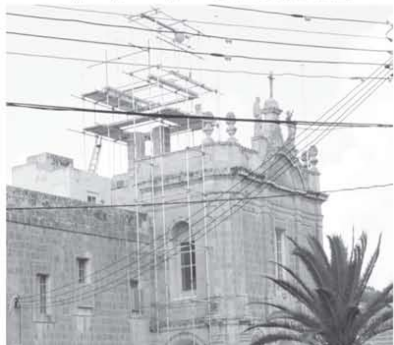
Ir-restawr tal-kampnar tas-Santwarju tal-Madonna tal-Grazzja