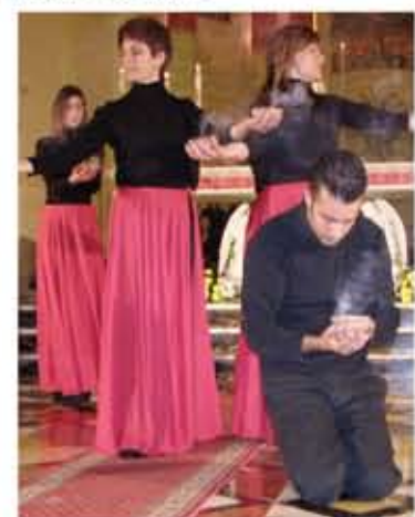
Mima konnessa mal-festa ta' Kristu Rè, mtella' miż-żgħażaġħ ta' San Lawrenz.

Hmistax ilu l-COMECE (il-Kummissjoni tal-Konferenzi tal-Isqofijiet tal-Unjoni Ewropeja) ġibdet l-attenzjoni għal dak li qalu xi membri parlamentari Ewropej dwar l-istess għaliha. "Kumpaniji li jdaħħlu l-haddiema għax-xogħol fil-jum tal-Fadd jirraportaw aktar każijiet ta' mard u assentejiżmu minn kumpaniji li ma jhaddmox il-Fadd. Is-saħħa tal-haddiema tiddependi, fost hwejjeġ oħra, fuq l-opportunitajiet li jingħatawlihom li jirrikonċiljaw ix-xogħol mal-hajja tal-familja, li jwaqqfu u jostnu kuntatti soċjali u billi jkunu jistgħu jissodisfaw il-bżonnijiet spiritwali tagħhom. Il-jum tal-Fadd, li tradizzjonalment huwa meqjus bħala l-jum ta' mistrieħ matul il-gimgha, jgħin biex jintlaħqu dawn l-għanijiet aktar milli kieku l-jum tal-mistrieħ jingħata f'xi ġurnata oħra tal-gimgha." Billi fis-16 ta' Diċembru li ġej il-Parlament Ewropew għandu jieħu vot dwar il-jum tal-Fadd, il-Knisja permezz tal-COMECE thegġeġ lill-membri parlamentari Ewropej biex jagħtu sehemhom halli din l-istituzzjoni tagħmel għażla li thares il-jum tal-Fadd, ikkunsidrat minn hafna bħala "għebta tax-xewka" fil-Mudell Soċjali Ewropew.