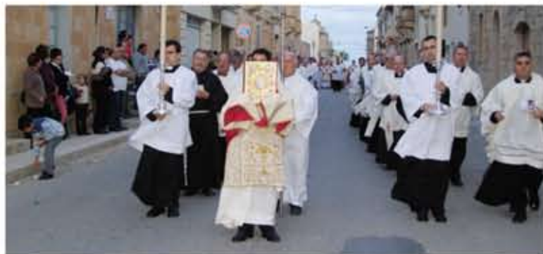
Il-Purċissjoni Ewkaristika ta' Kristu Rè miexxa lejn il-Knisja Rotunda.

Il-familja, speċjalment fejn hemm l-adolesxenti u ż-żgħażaġħ, issib diffikultà biex tgħaddi waqtiet sereni