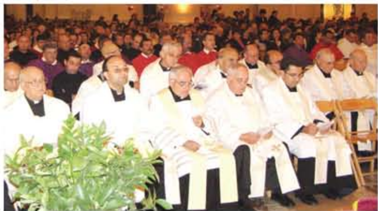
Parti mill-mijiet t'Għawdxin li allavolja kien hafna maltemp, attendew bi ngħarhom għal din il-Manifestazzjoni

Mons. Isqof spicċa d-diskors tiegħu billi qal illi huwa fatt li m'hemmx jum il-bniedem ( dies hominis ) jekk m'hemmx Jum il-Mulej ( dies Domini ).