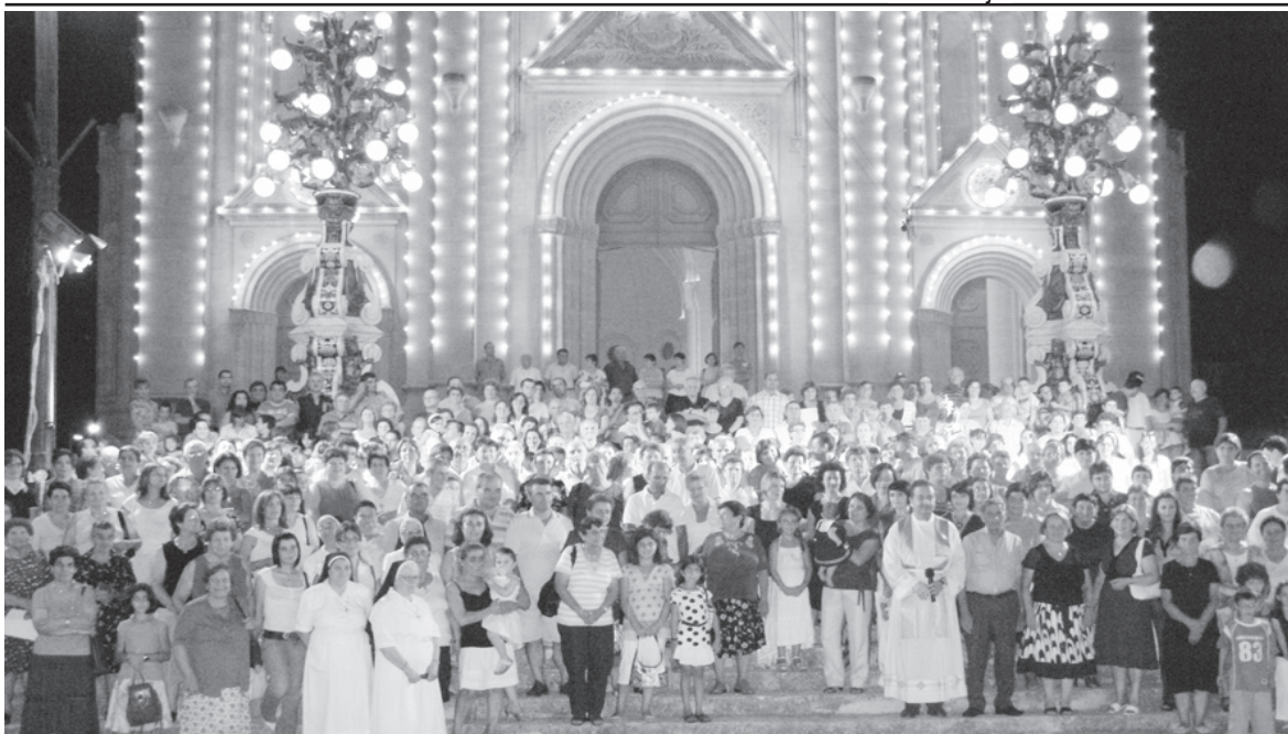
Uħud minn dawk preżenti għal-Lejla Marjana.