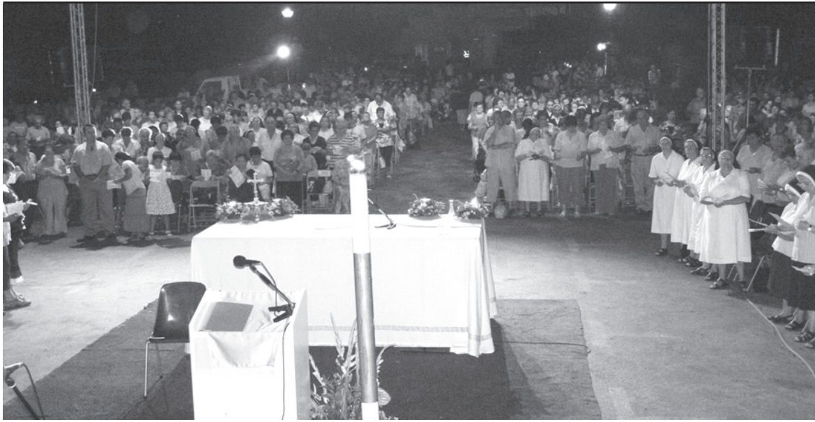
Parti mill-mijiet kbar ta' pellegrini li honqu l-Pjazza tas-Santwarju Nazzjonali tal-Madonna Ta' Pinu għall-Velja ta' l-Assunta.