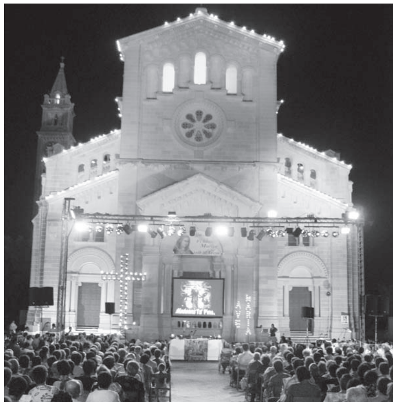
Mument waqt il-power point Pellegrini lejn is-Sema Pajjiżna, fil-Pjazza tas-Santwarju Nazzjonali tal-Madonna Ta' Pinu.