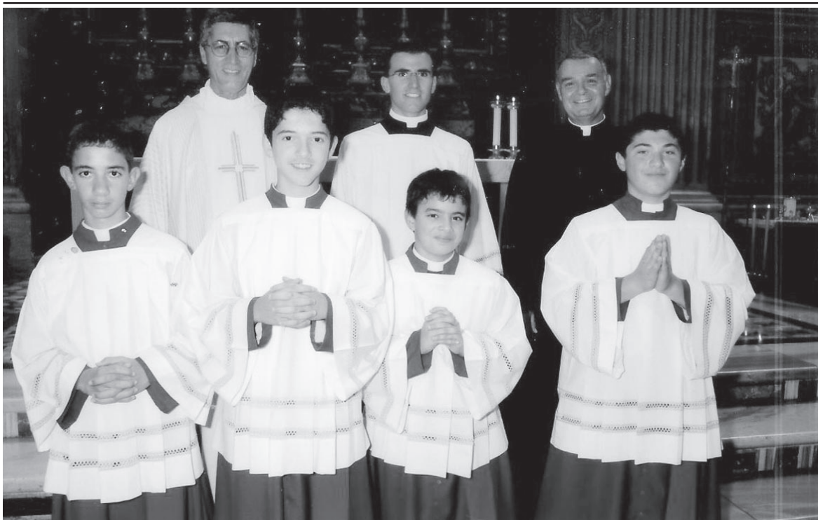
L-abbatini Għawdxi fil-Vatikan.

Sadanittant ta' min jgħid li wħud mil- leaders żgħażaġh li ħadu sehem fit-tmexxija ta' dan is- Summer Club fil-granet li għadew kienu l-Italja fuq programm ta' Skambju ta' żgħażaġh bħala parti mill- Youth in Action Programme ta' l-Unjoni Ewropeja. Dan l-iskamju kompli jgħinjom fil-formazzjoni tagħhom biex ikomplu jkunu ta' għajnunja lis-soċjetà tal-lum b'ħidma simili għal dak li għamlu tul is-sajf.