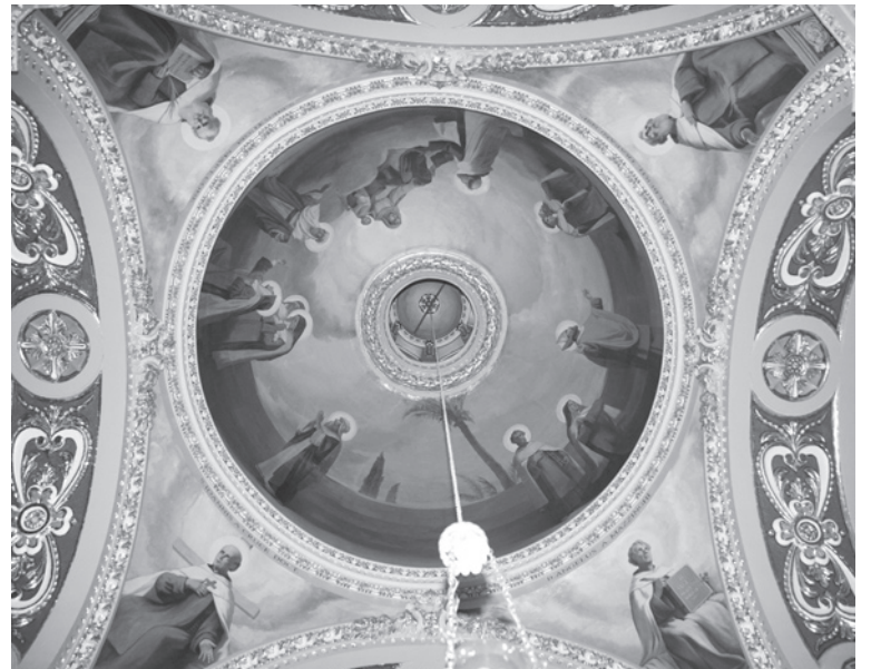
Il-pittura tal-koppletta rrestawrata.