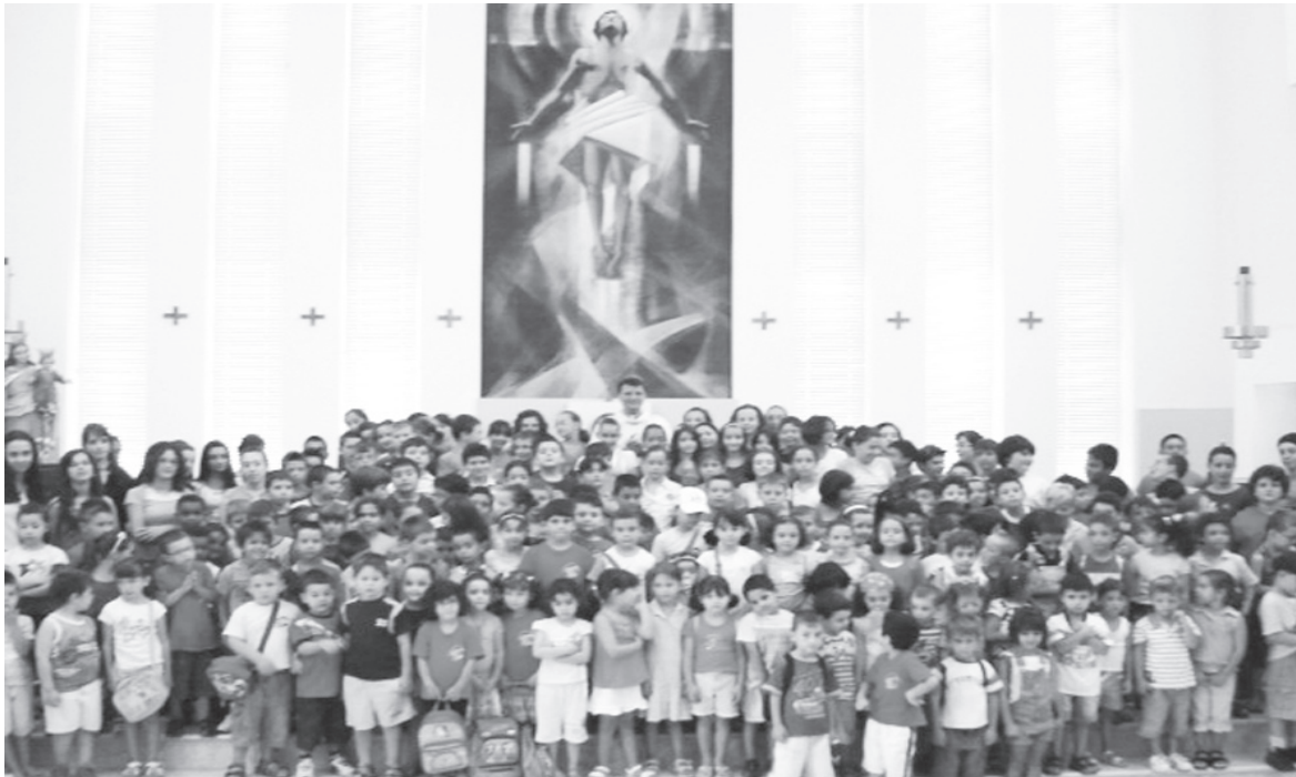
It-tfal flimkien ma' l-Isqof Mario Grech fi tmiem il-Quddiesa u z-żjara li għamlilhom.