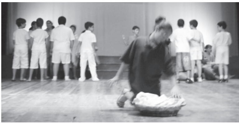
Waqt il-varjetà ta' l-aħħar.

Kull ġurnata tas- Summer Club kienet tibda' b'quddiesa fil-Kappella ta' l-Oratorju u wara t-tfal kienu jitqassmu fi gruppi fejn kienu jiġu mgħallma diversi suġġetti bħal