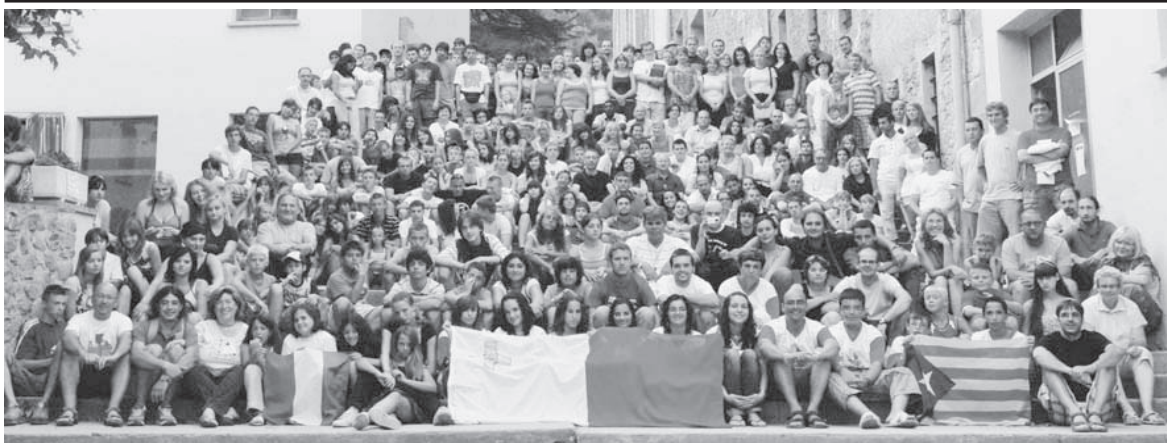
Il-Gruppi kollha, f'ritratt ta' l-okkażjoni, f' El Collell, Girona, Spanja fejn sar il-kamp tas-sajf.

ta' pellegrini minn kull rokna ta' kollha, b'mod speċjali fil-ġranet Għawdex u Malta matul is-sena tad-dehriet.