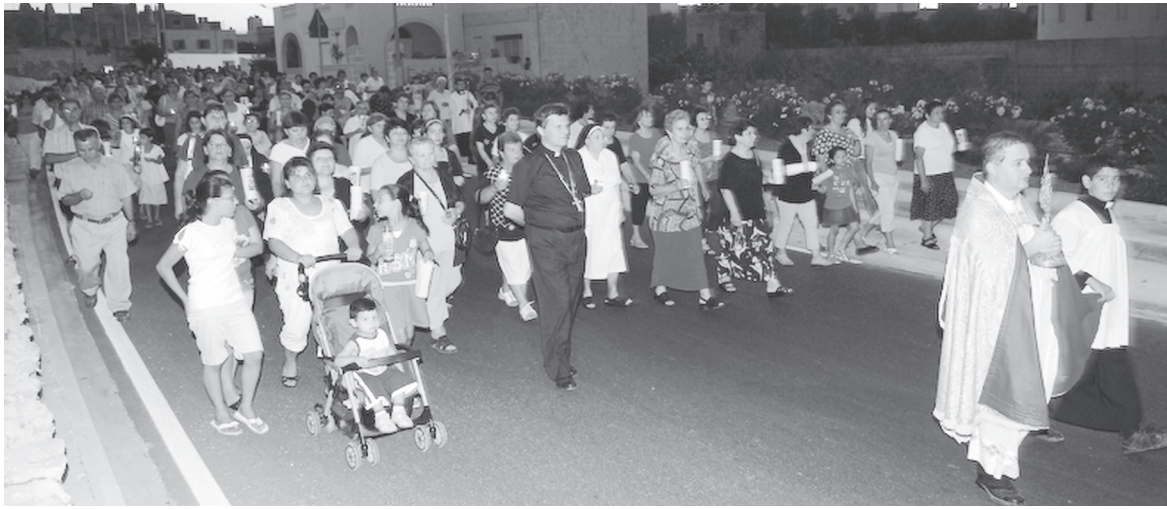
Il-Pellegrinaggj fi triqta lejn il-Grotta ta' Lourdes. U proprju hawnhekk il-pellegrini jidhru fit-triq prinċipali ta' l-Mgarr.