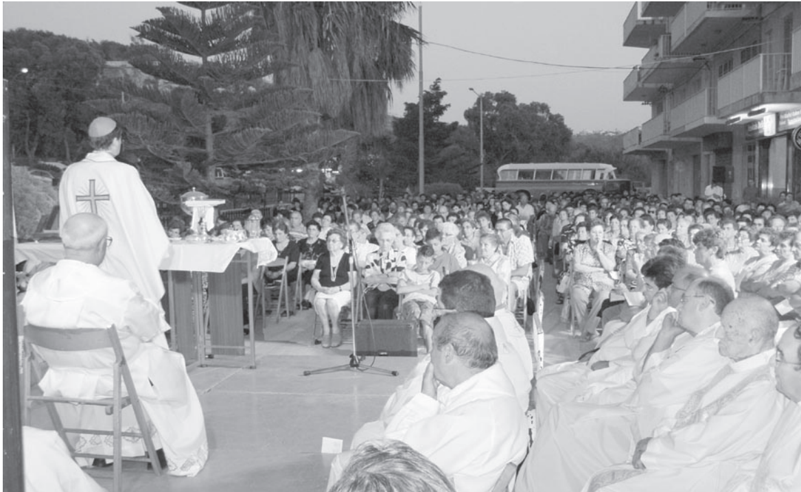
Folla numeruża ta' lajci nsara tattendi għall-Manifestazzjoni Marjana f'Marsalforn.