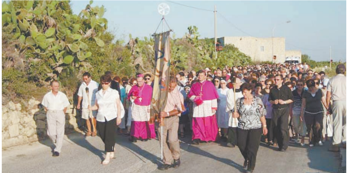
Il-Hadd 22 ta' Ġunju, fis-7.00 ta' filgħaxija. Pellegrinaġġ Nazzjonali mmexxi mill-E.T. Mons. Pawl Cremona O.P., Arcisqof ta' Malta, flimkien ma' l-Isqof ta' Għawdex, Mons. Mario Grech. Mixja minn hdejn is-Sigra, l-awrikarja, ta' Triq l-Għarb, sas-Santwarju Ta' Pinu.