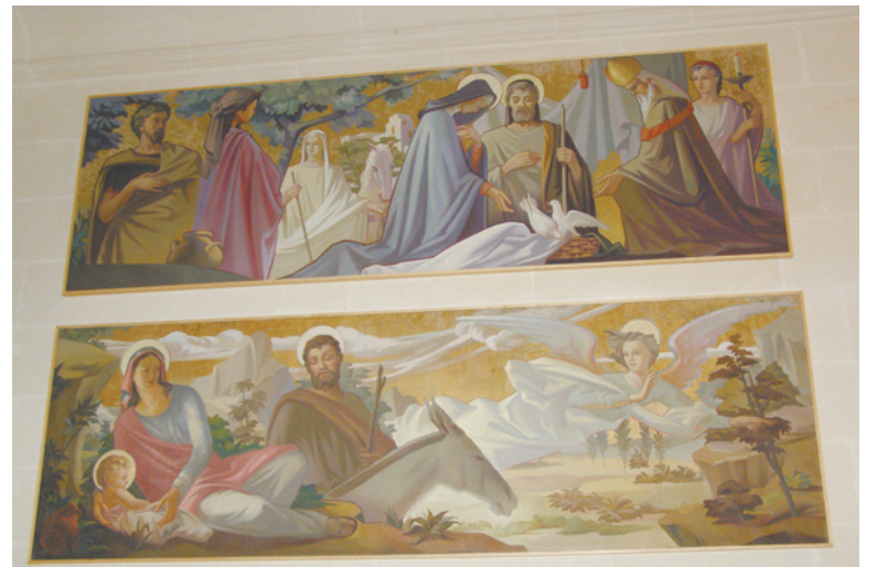
Is-Sala li fiha illum wiehed jista' jittpaxxa bid-diversi opri li fiha, fosthom il-pitturi ta' Emvin Cremona, li għe irrestawrati mill-pittur żagħżuġ Godwin Cutajar.