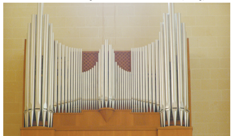
L-Orgni l-ġdid tad-Ditta Johannus-Monarke li għe inawgurat fis-Santwarju Ta' Pinu, nhar il-Ħamis 19 ta' Ġunju, fis-7.00 ta' filgħaxija.