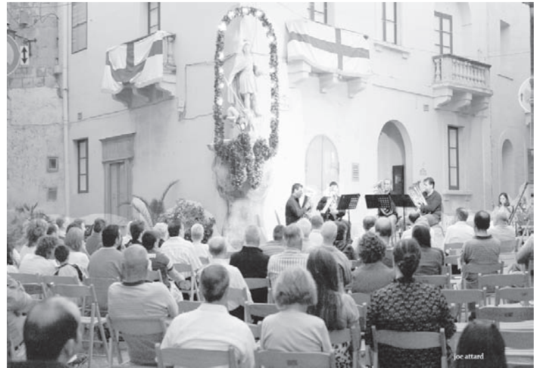
Waħda mill-attivitajiet li saru fil-Pjazzetta San Ġorġ tal-Ħaġar, ir-Rabat.