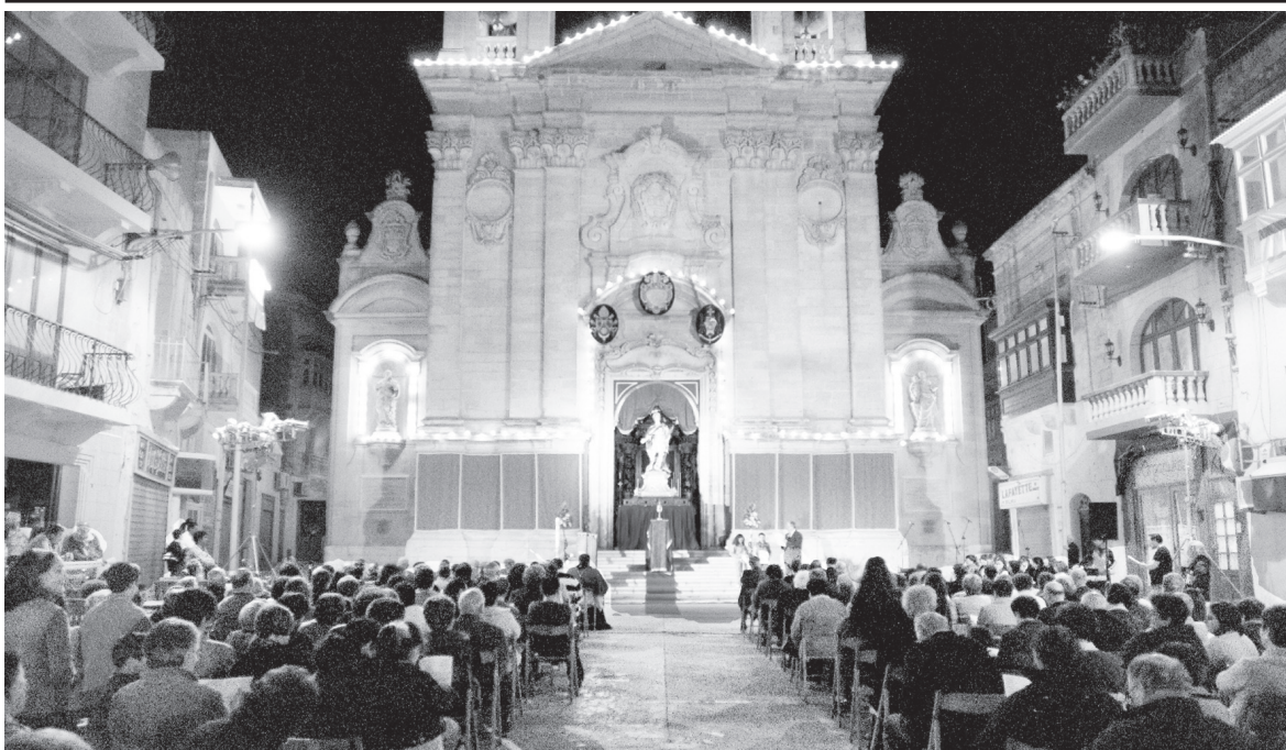
Waqt il-velja liturġika f'Ġieħ San Ġorġ