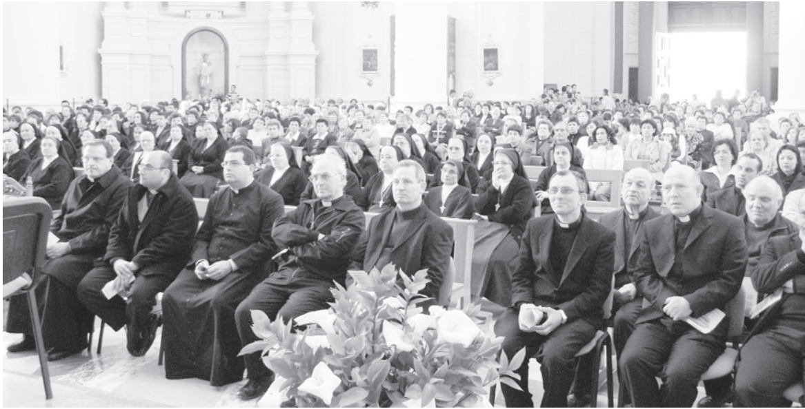
Dehra ġenerali ta' parti minn dawk prezenti fil-Knisja Rotunda għall-Kungress tax-Xirka.