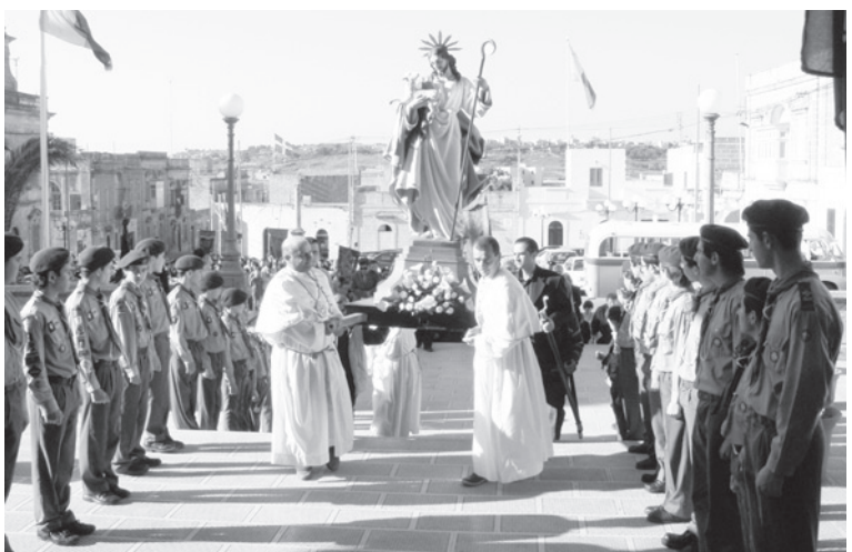
Il-Korteo mmexxi mill-Victoria Scout Group hekk kif wasal fuq iz-zuntier tal-Knisja Rotunda tax-Xewkija.