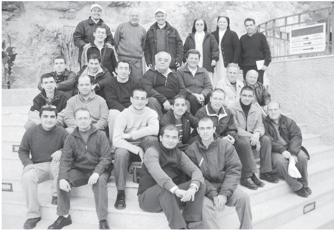
Il-Pellegrini fuq l-Għolja tal-Kwarantena