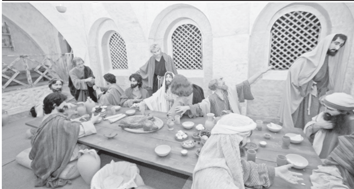
Il-Mejda ta' l-Appestli fil-M.U.S.E.U.M. tas-Subien, in-Nadur.