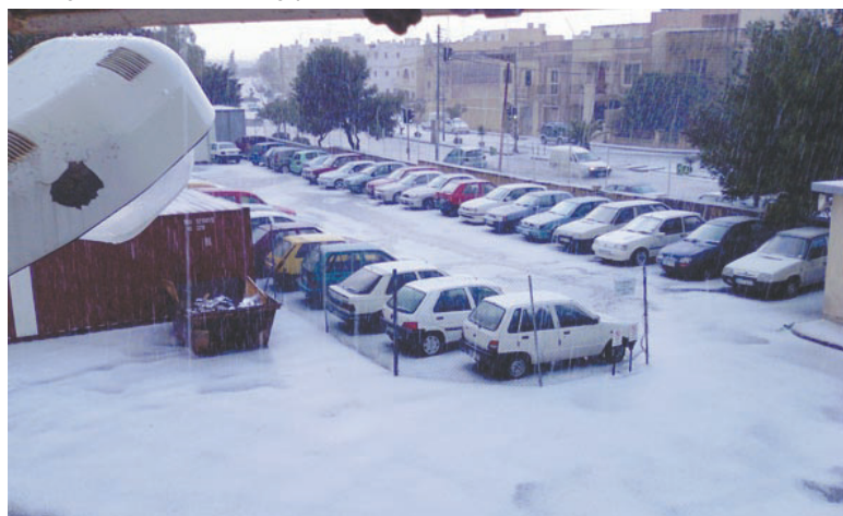
Dehra ta' l-art miksija madwar żewġ pulzjeri silġ f'San Ġwann

F'Malta s-silġ l-aktar li ħakem kien f'San Ġwann. Hawn is-silġ ukoll kien għoli madwar żewġ pulzjeri.