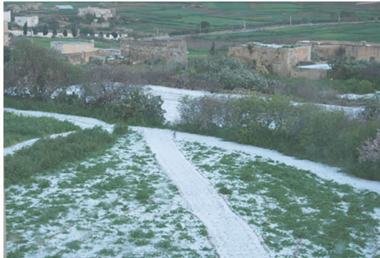
Uċuħ tar-raba' f'Għawdex miksijin bis-silġ