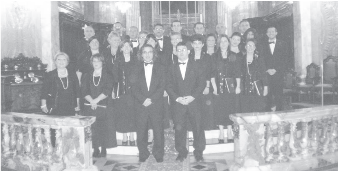
Il-Kor Għawdxi Gaulitanos

Wara l-interpretazzjoni ta' kull kor għalih, ta' għanjiet lokali tagħhom, iż-żewġ korijiet ingħaqdu flimkien għal tmien il-programm biex interpretaw Stille Nacht ta' Frans Grubber u l- Ave Verum ta' W. A. Mozart.