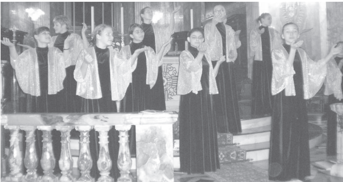
Il-Kor Russu 'Vera Chamber Choir'