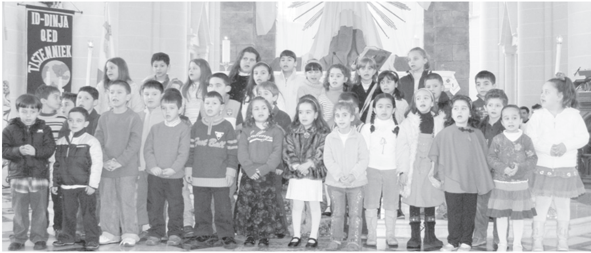
Tfal Għajnselmizi jkantaw innijiet tal-Milied