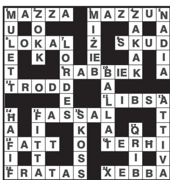
SOLUZZJONI TAL-ĠIMGĦA L-OHRA