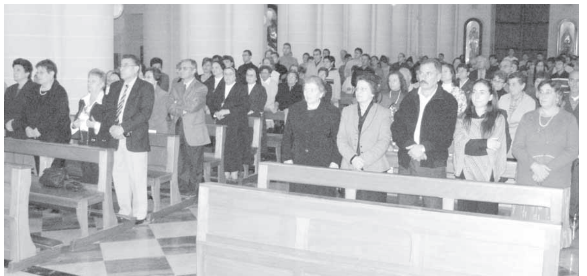
Parti mill-Kongregazzjoni preżenti għaċ-ċelebrazzjoni tar-Rit ta' l-Ammissjoni tas-Seminaristi Għawdxin, fil-Knisja Parrokkjali t'Għajnsielem