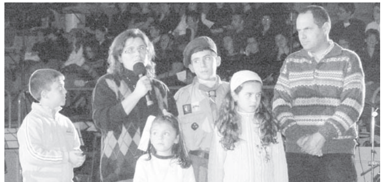
Il-Koppja Muscat tagħti l-esperjenza tagħha ta' fidi.