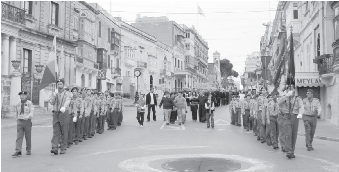
Il-Korteo, immexxi mill-Victoria Scout Group fi triqta lejn il-Kumpless Sportiv