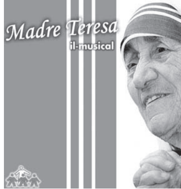
Il-faccata tal-qoxra tas-CD l-iskejjel.

Kopji tas-CD "MADRE TERESA - il musical" jistgħu jinkisbu mill-Oratorju Don Bosco t'Għawdex, jew inkella billi wieħed iċempel fuq in-numri 21556616 jew 99487751.