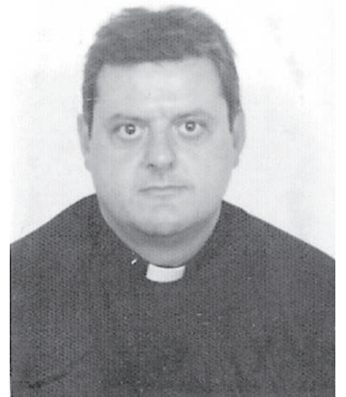
Dun Franz Refalo

Fl-1 ta' Novembru 1993 mar jaħdem fid-Djoċesi Suburbicaria ta' Sabina-Poggio Mirteto fejn kopra l-inkarigi ta' Viċi-Parroku u Diret-